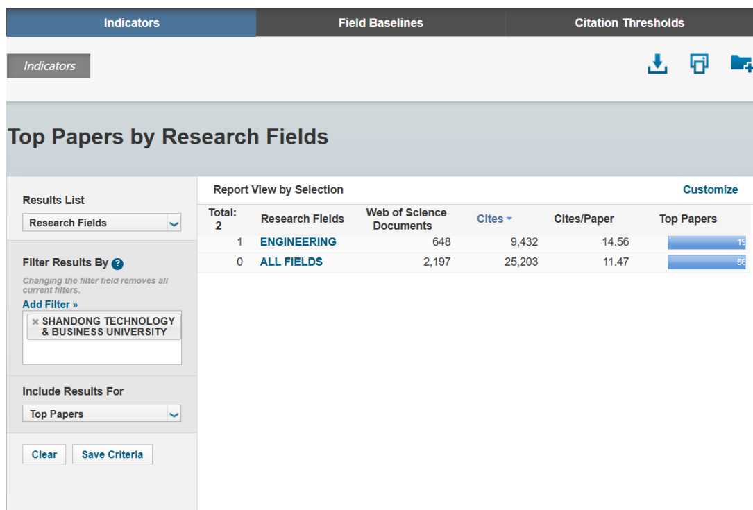
图 1 2026 年 3 月我校 ESI 前 1%学科（工程学）

表 1 列出了我校本期工程学科的指标数据。根据 ESI 最新数据，截至 2026 年 3 月 12 日，我校工程学领域的 WOS 论文总数为 648 篇，较 2026 年 1 月 8 日新增 34 篇，论文总被引用频次为 9432，较上一期增加 681 次。本期数据显示目前本机构高被引论文 19 篇。